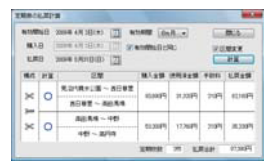
定期券払い戻し計算